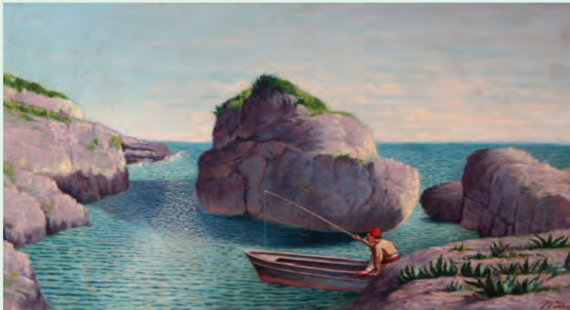
Kolë Idromeno: Pamje nga Ulqini